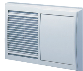
長方形・その他の換気口