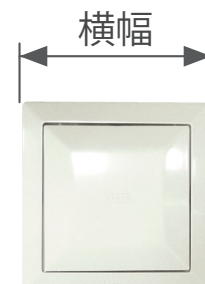
正方形・長方形の換気口の場合